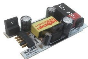
Блок внешнего питания KG-PSU2 12, 220В для электронной сантехники серии KR с функцией UPS (в комплект не входит)